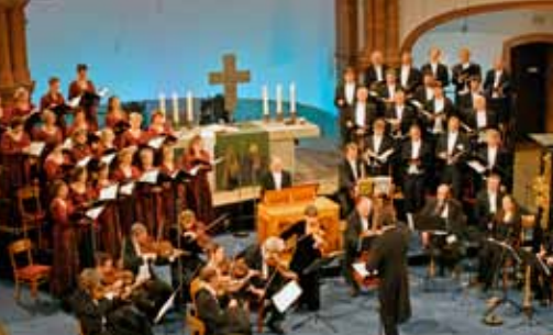
RIAS Kammerchor & Akademie für Alte Musik Berlin