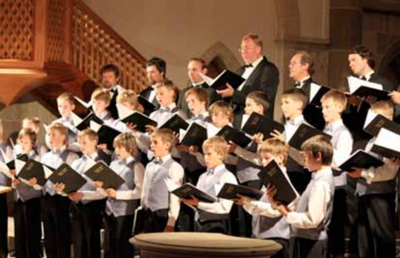
Riga Dom Cathedral Boys Choir